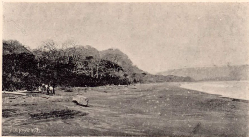
Vistas de la bahía de Caldera (Costa Rica)